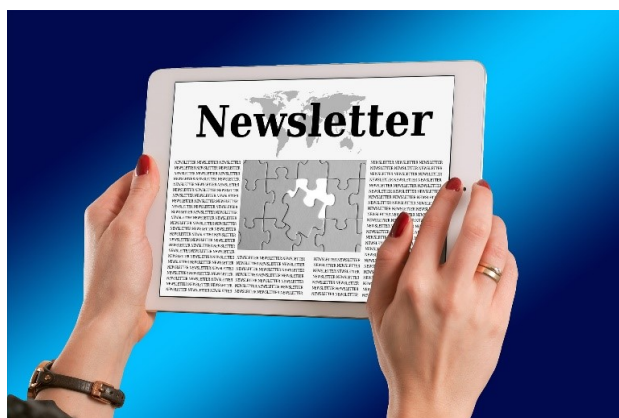
Figura 2. Esse texto é um exemplo do formato esperado para legendas que ultrapassem mais de uma linha. Devem ser justificados e recuados 0.8cm em ambas as margens.

empíricos, não use mais dígitos decimais do que os que garantem a sua precisão e reprodutibilidade. A legenda da tabela deve ser colocada antes da tabela (veja a Tabela 1) e a fonte usada deve também ser Helvética, 10 pontos, negrito, com 6 pontos do espaço antes e depois cada legenda.