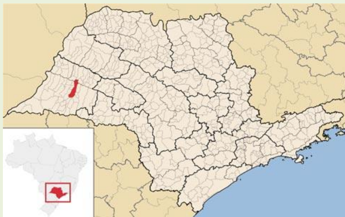
FIGURA 1 – Localização de Presidente Prudente a extremo oeste do estado de São Paulo

A pesquisa ocorreu na cidade de Presidente Prudente. O município pode ser caracterizado como de médio porte, com uma população estimada em 227.072 habitantes (IBGE, 2018). Está localizado a oeste da capital do estado de São Paulo, distando desta cerca de 558 km.