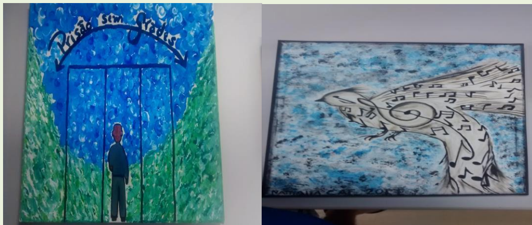
FIGURA 3 – Trabalho em duplas resultado da temática direitos individuais

linguagem, gerando uma sensação de falsa liberdade nas palavras das estudantes, representado pela Figura 3.