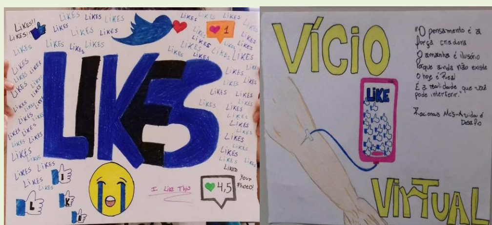
FIGURA 4 – Trabalho individual resultado da temática Rótulos Sociais e Sujeitos de Direitos.

eu-lírico, tipicamente masculino, apresenta sem rodeios suas intenções de obter prazer com seu objeto de desejo, e pode ser interpretado de forma agressiva e independente da vontade do objeto, um outro personagem. Ao menos na sala de aula foi nítido, um contraste, entre as letras e os eu-líricos trazidos por elas, cujo contraste já era esperado ao reconhecer o gênero musical.