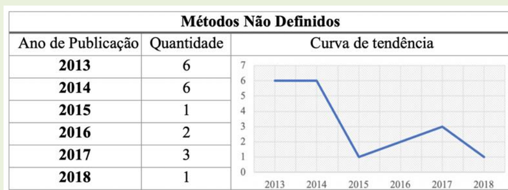
TABELA 2 – Método não definidos

De certo que as avaliações apresentadas se deram em tempo anterior ao vivenciado hoje e como o presente estudo busca padrões recentes, percebeu-se que a ausência de definições tem decaído no período investigado, como se demonstra na Tabela 2 e no gráfico de linha logo abaixo, revelando avanço: