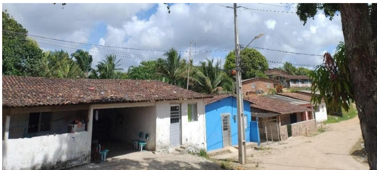
Figura 1 – Casas da comunidade quilombola de Onze Negras

Sendo assim, a comunidade quilombola de Onze Negras demonstrou ser um importante campo de investigação sobre as questões relacionadas à presença de Políticas Públicas, em especial, as Políticas Públicas de educação em saúde, indicando que, mesmo em um município de grande poder aquisitivo, como o Cabo de Santo Agostinho, o fator financeiro não pode ser apenas o único indicador de desenvolvimento humano, outros fatores tendem a ser considerados, como saúde. Educação, segurança entre outros.