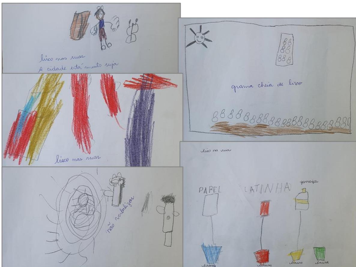
Figura 2 – Desenhos das crianças sobre lixos nas ruas

socialmente situada. Nesse sentido, os desenhos não devem ser lidos apenas como ilustrações, mas como textos visuais que expressam pensamentos, valores e preocupações das crianças, oferecendo à escola um ponto de partida potente para a construção de práticas curriculares que integrem diferentes áreas do conhecimento em torno de problemas sociais significativos, como o lixo, promovendo reflexão crítica, participação e formação cidadã desde a Educação Infantil.