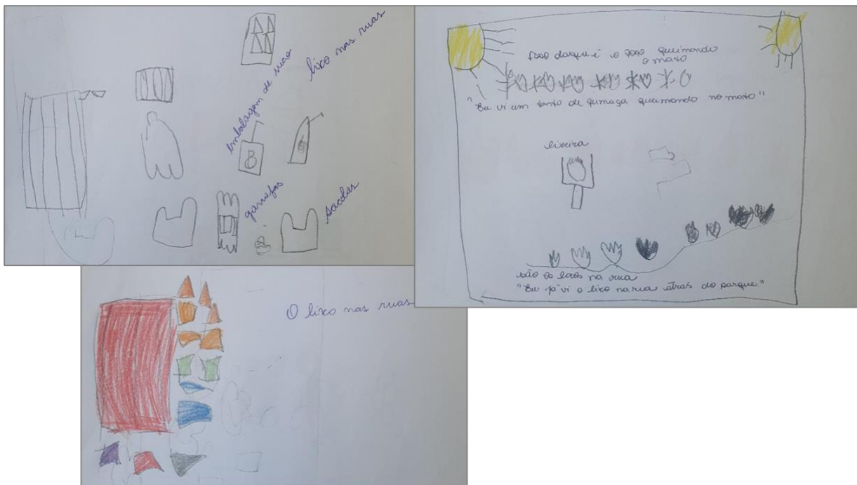
Figura 1 – Desenhos das crianças sobre lixos nas ruas

À luz de Beane (2003), estas produções gráficas podem ser compreendidas como manifestações de um currículo vivido, no qual o conhecimento emerge das preocupações reais das pessoas e de sua relação concreta com o mundo social. Ao desenharem sacolas, latas, papéis, garrafas e lixeiras, algumas delas inclusive identificadas por tipo de material — papel, latinha, garrafa —, as crianças revelam não apenas uma leitura crítica do problema, mas também indícios de apropriação de práticas e discursos escolares relacionados à separação do lixo e à responsabilidade ambiental. Tal movimento evidencia o potencial da integração curricular para articular saberes ambientais, sociais e éticos, superando a fragmentação disciplinar.