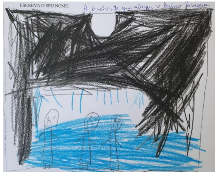
Figura 6 – Desenho da criança sobre enchentes

A Figura 6 refere-se à categoria que trata das enchentes causadas pelas chuvas na cidade.